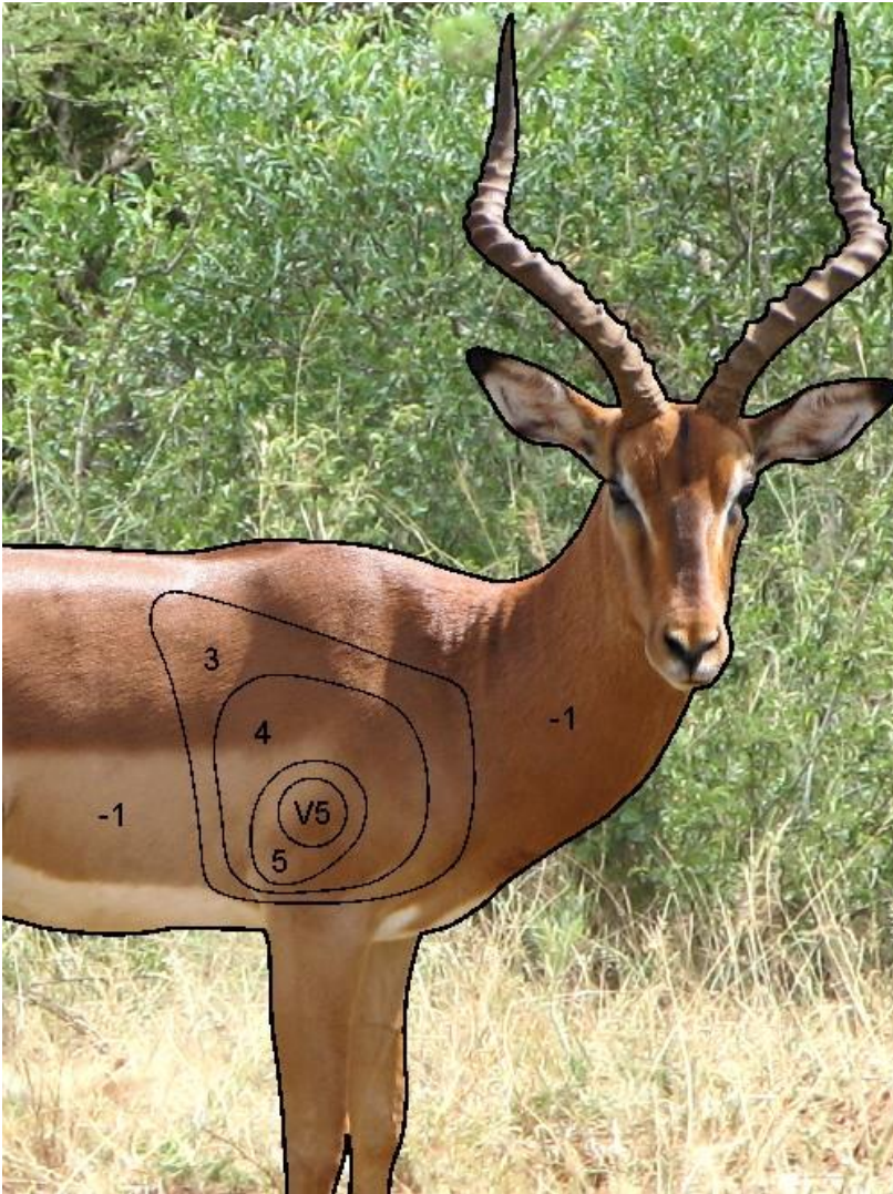
Teiken werklike grootte: W x H = 750 x 1000m